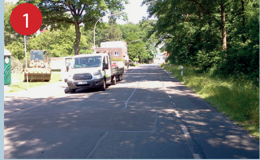
1 Bei der Abkürzung durch den Wald gibt es keine gute Überquerungsstelle. Jüngere Kinder sollten lieber den Weg über die Mittelinsel auf der Ellerstraße nutzen.