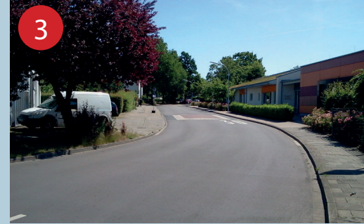
3 Um die Ampel an der Ellerstraße zu erreichen, muss die Mecklenburger Straße überquert werden. Üben Sie das Überqueren hier gut mit Ihrem Kind ein.