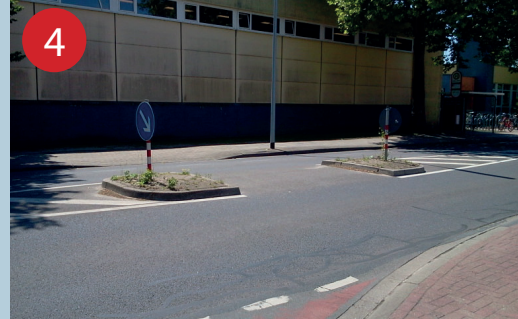
4 Achtung, hier ist zuviel Verkehr! Bitte immer die Ampel nutzen. Seien Sie stets Vorbild für die Kinder.