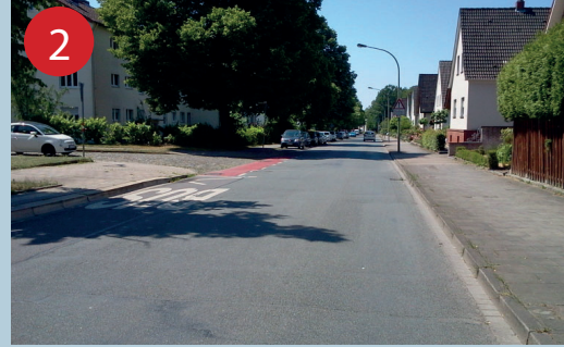
2 Achtung beim Überqueren der Ellerstraße! Üben Sie das Überqueren mit Ihrem Kind. Im Zweifel begleiten Sie Ihr Kind oder bilden Gehgemeinschaften.